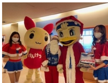
ゆけつちゃん、マリノスケ、チアガール 写真⑤ 中央は看護科長サンタ