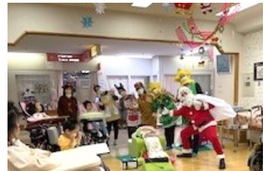
難病ネットサンタさん 写真③ 重心施設ひだまりにて