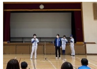
ベイスターズの選手 写真⑥ 僕たちも頑張る! 来年優勝!