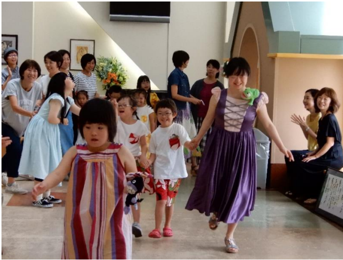
上・手作り子供服ファッションショー

いました。キュアの側に立つ専門職の方々にもご理解をいただいで、そのような声をかけていただいたのはとても嬉しかったです。