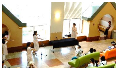
上・にじいろえほん箱 下・高校生による「英語を楽しもう」

最初にこの英語企画を考えていた時には、シンプルなおアイデアを形にするだけで入院中の子ども達皆をこんなに喜ばせることができると思っていました。この気持ちは本当に言葉でうまく伝えられませんが、皆さんが喜んでくれて嬉しかったです。病院の誰かに少しでも楽しい思い出を作ったあげられたなら、私の今年の夏休みはそれだけの価値があったと思います。日本に来て、こども医療センターで活動出来て本当に良かったです！皆さんとぜひ、また会いましょう。