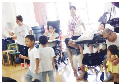
上 こどものダンス 重心 下 手回しオルゴール NICU