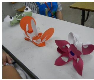
上 近代美術館作品作ろう (肢体) 下 ピカチュウ病院訪問(総合待合)