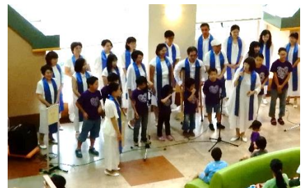
上・ゴスペルコンサート 下・モンゴル馬頭琴