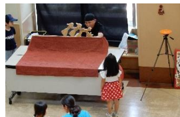
上・ウッドシアター 下・水晶玉イベント