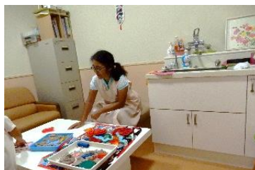
上・お砂場とビーズ 下・木のおもちゃで遊ぼう